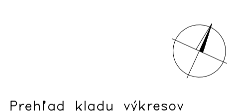
Přehľad kladu výkresov